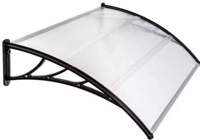
Skärmtak typ 2

Luthagen 6:1 och 7:3, Uppsala kommun Brf Kurvan, fadasändring / Bilaga till bygglovsansökan Skärmtak typ 1 och