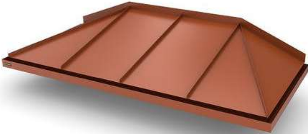
Skärmtak typ 1